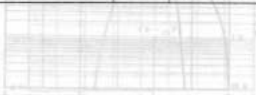
(1) V_{DS} = -10\text{V}, I_D = -1.0\text{mA}