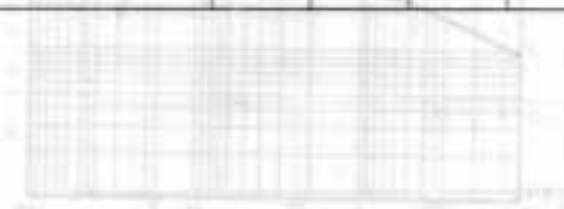
(2) V_{GS} = 0\text{V}, I_D = -1.0\text{mA}